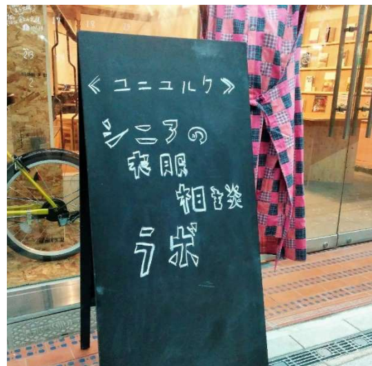
看板と《ユニユルク》ナイトウェア(パジャマ)▲